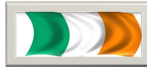
Cork - Irland