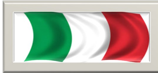
Triest - Italien